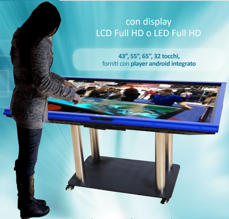
SMT-43-32 / SMT-55-32 / SMT-65-32 / SMT-70