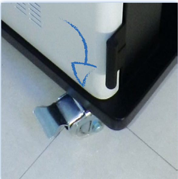
Rodas giratórias auto-travamento