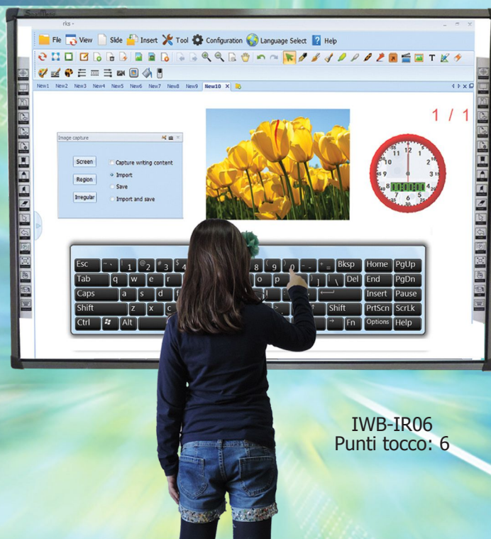
IWB-IR06 Punti tocco: 6

Un potente strumento per rendere interattivo l'apprendimento