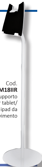
Cod. SM18IIR Supporto per tablet/ ipad da pavimento