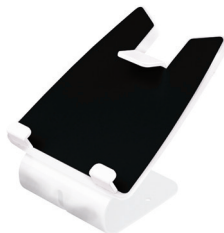
Cod. SMH0238 Supporto per tablet/ipad da tavolo o parete