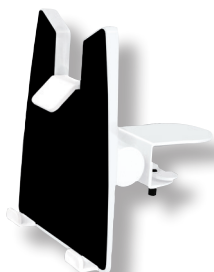
Cod. SMH0237 Supporto per tablet/ ipad da mensola

Compatibile con Tablet, iPad, eBook Reader e devices da 9,7" a 13", sono disponibili in molteplici versioni per soddisfare qualsiasi esigenza.