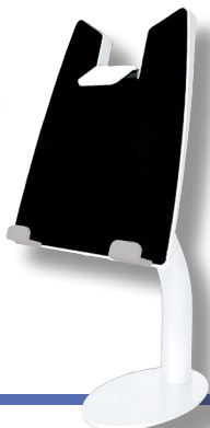
Cod. SM1807 Supporto per tablet/ipad da tavolo