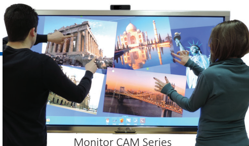
Monitor CAM Series