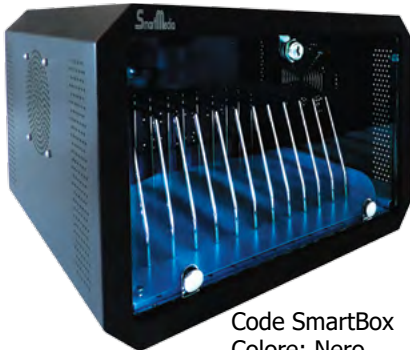
Code SmartBox Colore: Nero