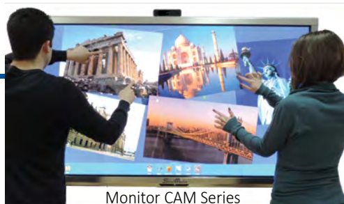
Monitor CAM Series